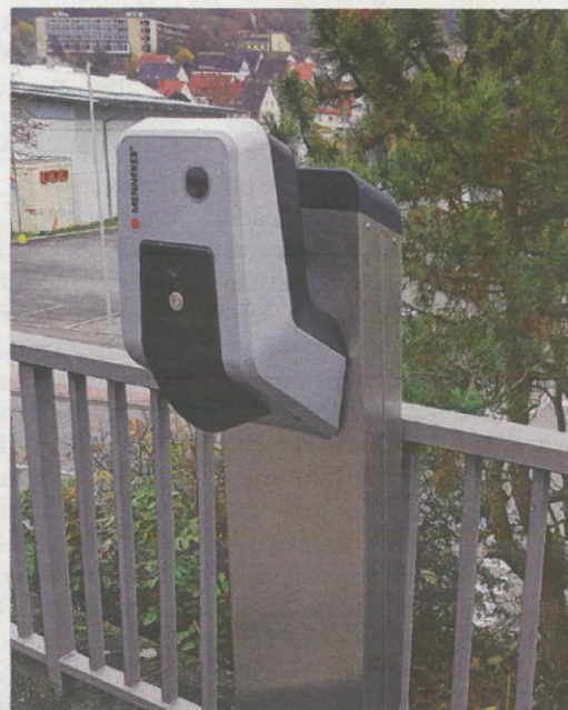
Bei Interesse können Sie sich die Ladestationen bei den SWL ansehen – als Beispiel mit Standfuß (Bild) oder als Wallbox.

Da bei der Einrichtung einer Elektro-Ladestation einige Grundvoraussetzungen erfüllt sein müssen, sollten Sie sich durch einen Elektrofachmann Ihres Vertrauens oder durch Ihre Stadtwerke beraten lassen. Kommen Sie hierfür einfach auf uns zu.